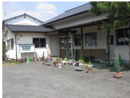
Our beloved school