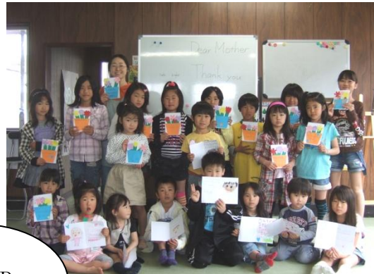
These are the cards we made!