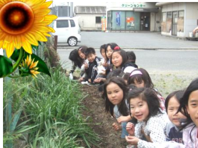
Watching the seeds grow!