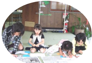
I think my card looks good!