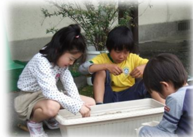
Planting the seeds.