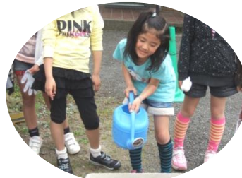
Watering the seeds