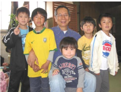
This is our "boys club".