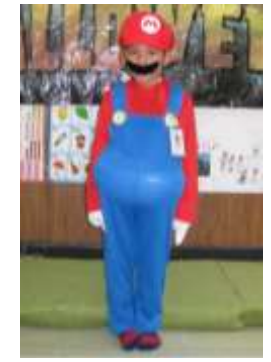
第2位 スーパーマリオ