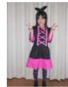
第4位 不思議の国のアリス バニーヴァージョン