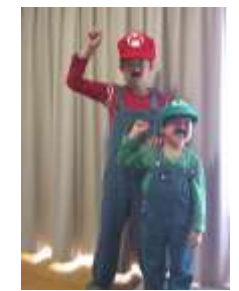
第5位 マリオ&ルイージ

パーティーのフィナーレはプライマリー3、プライマリー4クラス制作のホラーハウスでした。たくさん叫び声や泣き声がおけ屋敷に響きました。生徒の中には怖さのあまりゴールまでたどり着けない子もいましたが、そんなことは問題ではありません。みんな恐怖体験を楽しんでいました。そして、生徒達はもう来年のハロウィンを楽しみにしています。