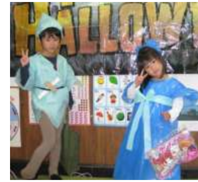
第1位 ピーターパン&ウェンディ

ベネのイベント(パーティーやフェロシップ等)はビンゴゲームなしでは語れません。今回のビンゴゲームは嬉しいことに参加者全員に賞品が当たりました。