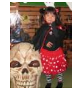
第3位 ミニーマウス